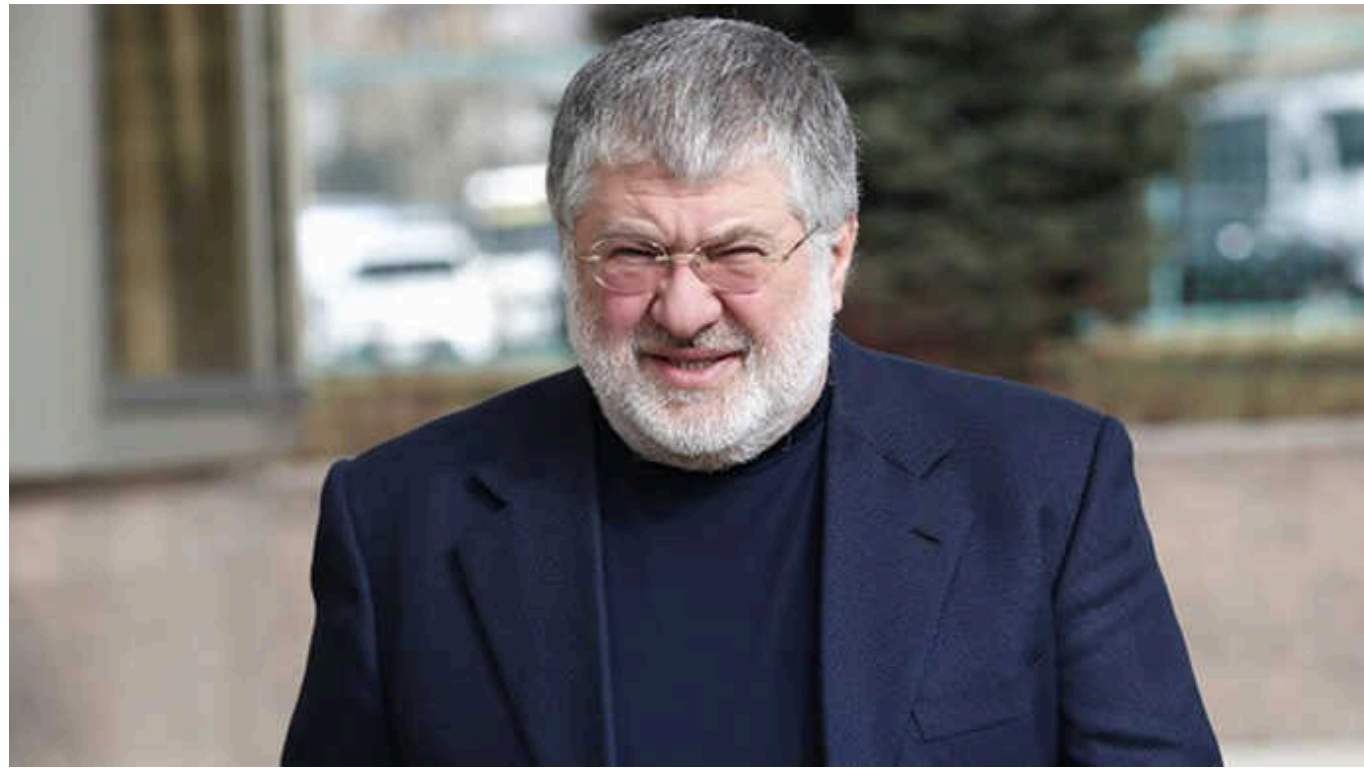
Коломойський у 2024 вибув із рейтингу мільярдерів Forbes

У рейтингу 2023 співвласник групи «Приват» посідав 2540 місце з $1 млрд.