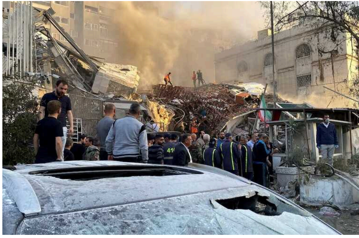
В ООН засудили авіаудар по консульству Ірану в Сирії

Генеральний секретар ООН Антоніу Гутерреш засудив напад на дипломатичну установу Ірану в столиці Сирії Дамаску, внаслідок якого було ліквідовано іранського воєначальника.