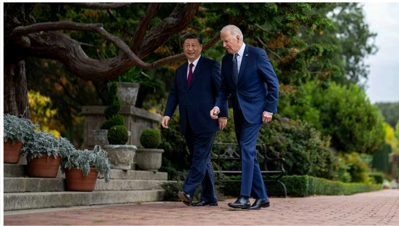
Сі та Байден провели телефонну розмову: обговорили війну в Україні

Зокрема, як повідомляє New York Times, Байден "хотів наголосити Сі Цзінпіню, що Китай не повинен продовжувати допомагати Росії відновлювати її військово-промислову базу".