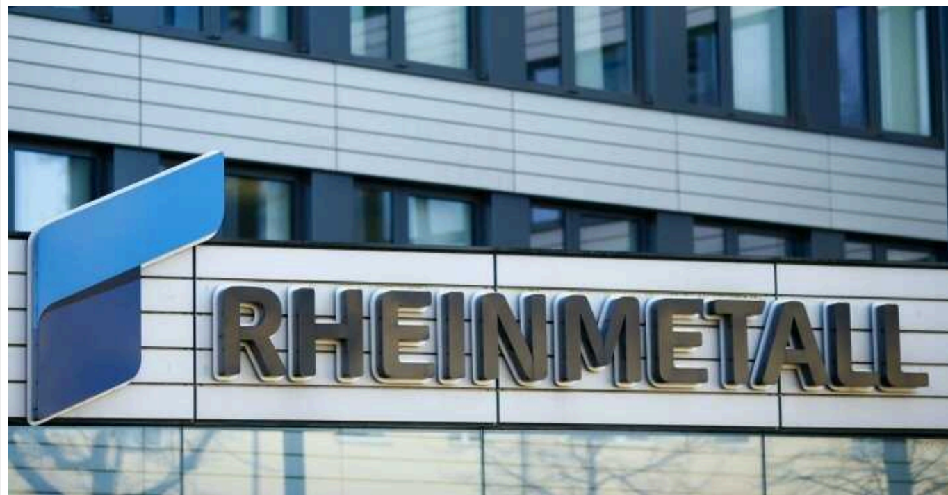
У рамках підготовки до проєкту Rheinmetall Литва може пом'якшити правила будівництва

Міністерство економіки та інновацій Литви пропонує внести зміни до кількох законів, які дозволили б великим західним виробникам зброї та боєприпасів, у тому числі німецькому концерну Rheinmetall, швидко перенести виробництво до країни.