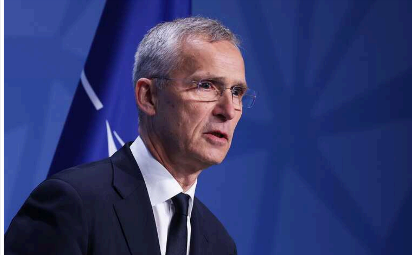
У НАТО поки не знають, коли визначаться з наступником Столтенберга

У Північноатлантичному альянсі ще тривають дебати з приводу того, хто саме стане наступником Єнса Столтенберга на посаді генерального секретаря, і точно невідомо, скільки часу ще займе цей процес.