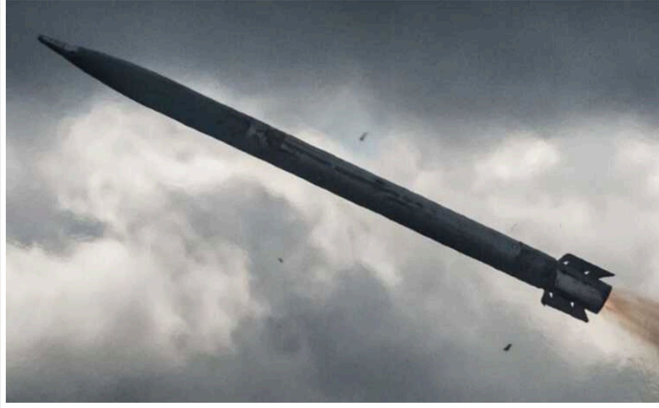
Ракетний удар по Дніпру: зросла кількість постраждалих, серед них п'ятеро дітей

Кількість постраждалих внаслідок ракетної атаки РФ на Дніпро 2 квітня зросла до 13 осіб, серед них п'ятеро дітей.