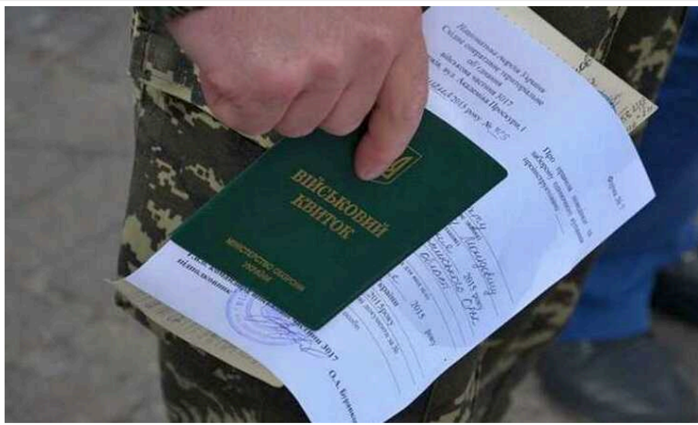
Обмежено придатні мають повторно пройти ВЛК, - нардеп

Президент Володимир Зеленський підписав законопроект №10313, який стосується повторного медичного огляду обмежено придатних чоловіків.