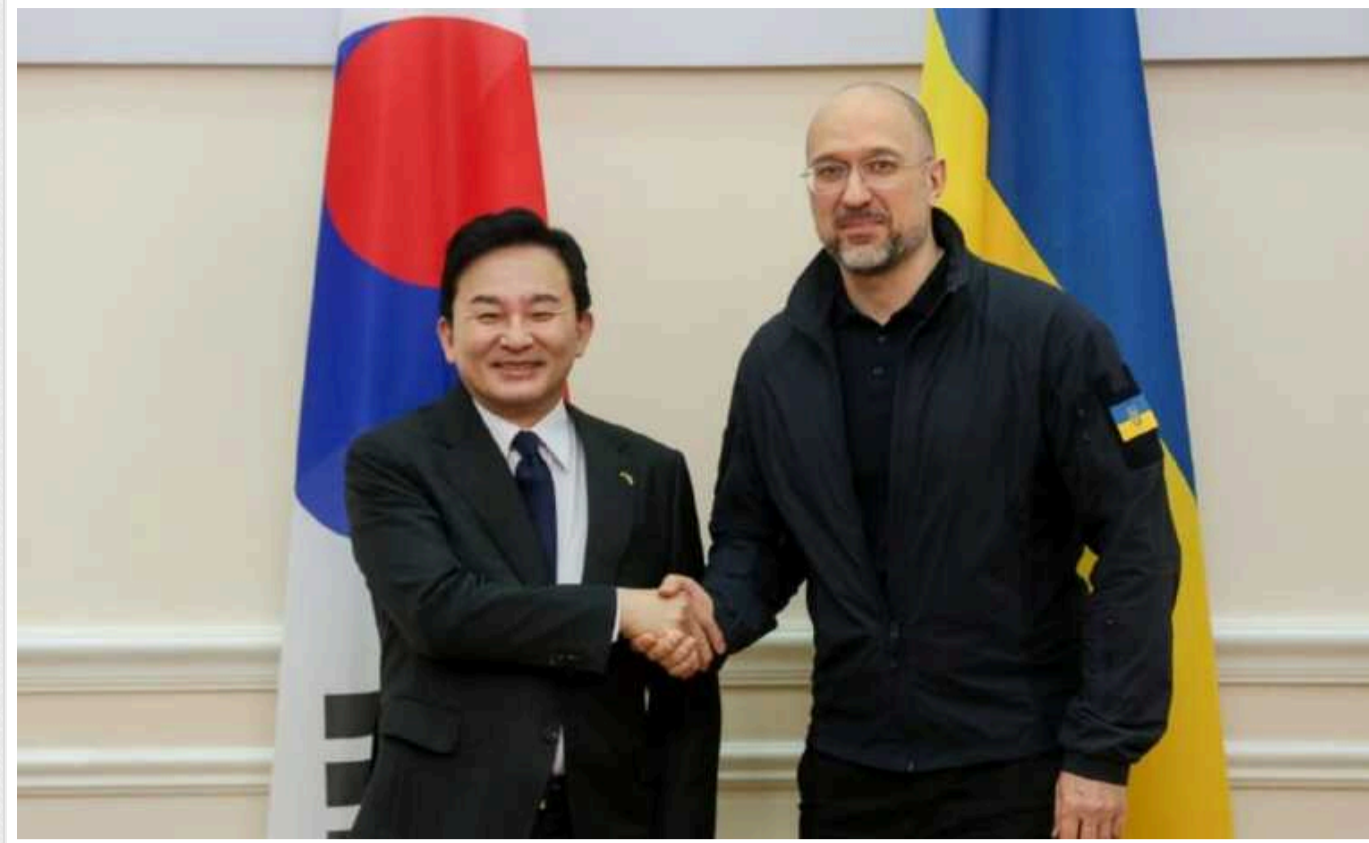
Кабмін схвалив угоду з Південною Кореєю про пільгові кредити на 2 мільярди доларів

Кабінет міністрів схвалив проєкт Рамкової угоди між урядами України та Республіки Корея щодо кредитів від Фонду економічного розвитку та співробітництва на 2024-2029 роки.