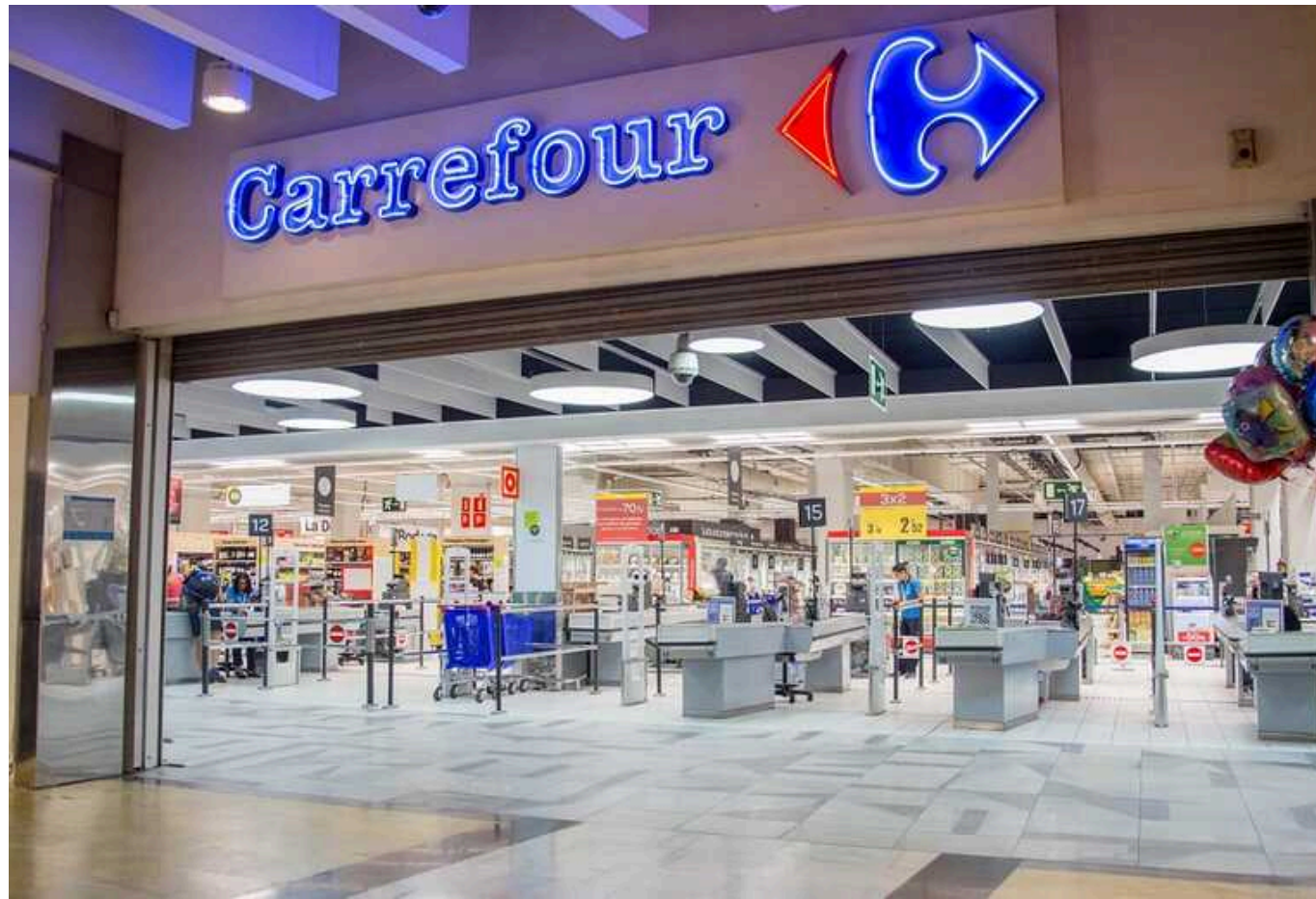
Французька Carrefour може розглянути покупку мережі «Сільпо» та АТБ в Україні

Друга за величиною у світі французька мережа продуктових гіпермаркетів Carrefour веде переговори щодо купівлі контрольного пакету акцій мережі супермаркетів АТБ чи «Сільпо» в Україні.