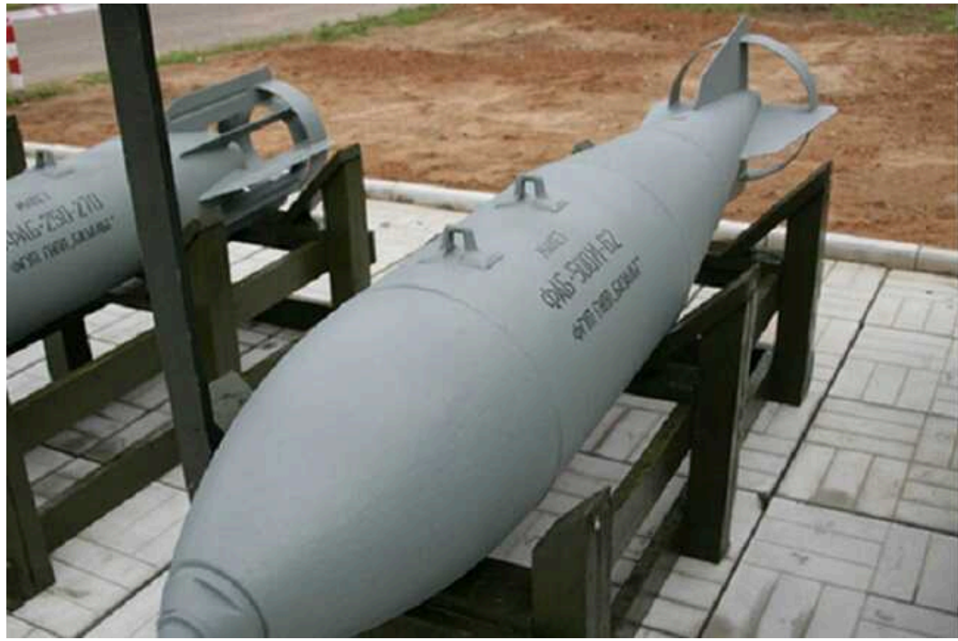
В окупованому Рубіжному біля залізничного вокзалу впала російська авіабомба

У тимчасово окупованому Рубіжному на Луганщині біля залізничного вокзалу з російського літака впала авіаційна бомба. Це вже другий випадок скидання російських боєприпасів на місто.