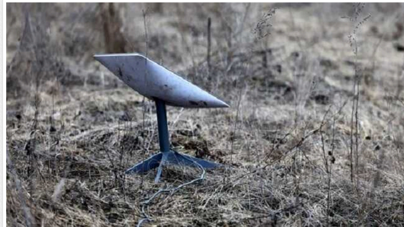
Рішення знайшлося: армія РФ максимально обмежена у використанні Starlink, – Мінцифри

За словами міністра цифрової трансформації Михайла Федорова, Україна продовжує залишатися на зв'язку із засновником американської компанії SpaceX Ілоном Маском, а їхні команди працюють разом.