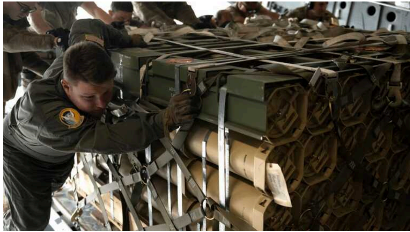
США хочуть подвоїти виробництво боєприпасів, щоби підтримати Україну, — ISW

За словами аналітиків, Пентагон уже уклав контракт на будівництво трьох виробничих ліній деталей 155 мм боєприпасів. Вони повинні розташуватись у штаті Техас.