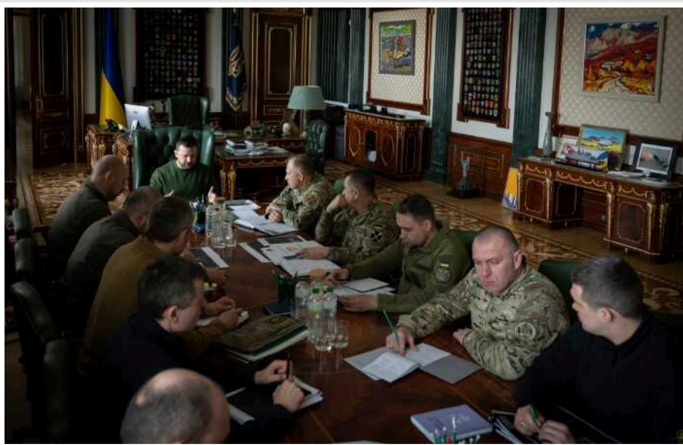
Зеленський провів нараду з військовими й урядовцями

Президент України Володимир Зеленський провів з військовими та урядовцями нараду щодо дронів.