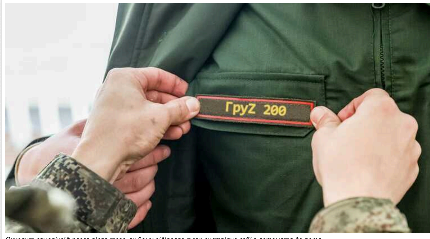
Окупант самоліквідувався після того, як йому відірвало руку: вистрілив собі з автомата до рота

Російський солдат застрелився із автомата після того, як був поранений на полі бою, та залишився без руки.