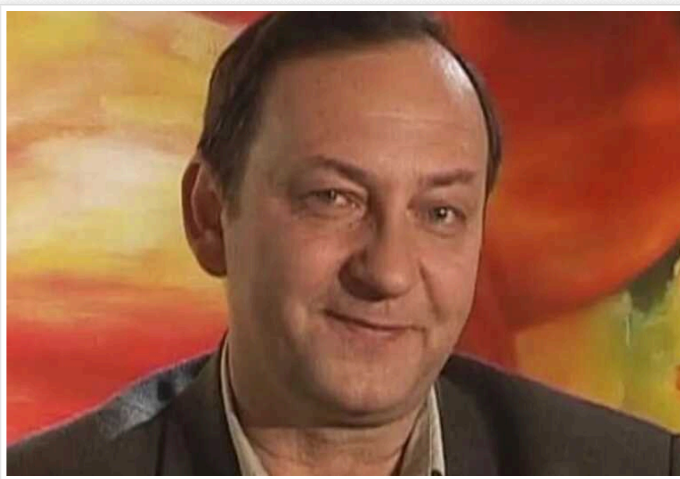
Помер капітан "Одеських джентльменів": Святослав Пелішенко з 1991 року жив і працював у Росії

У неділю, 31 березня, помер український сценарист, шоумен, учений-фізик Святослав Пелішенко, найбільш відомий як капітан колись популярної команди КВК "Одеські джентльмени". Гумористу був 71 рік, точну причину його смерті не розкривають.