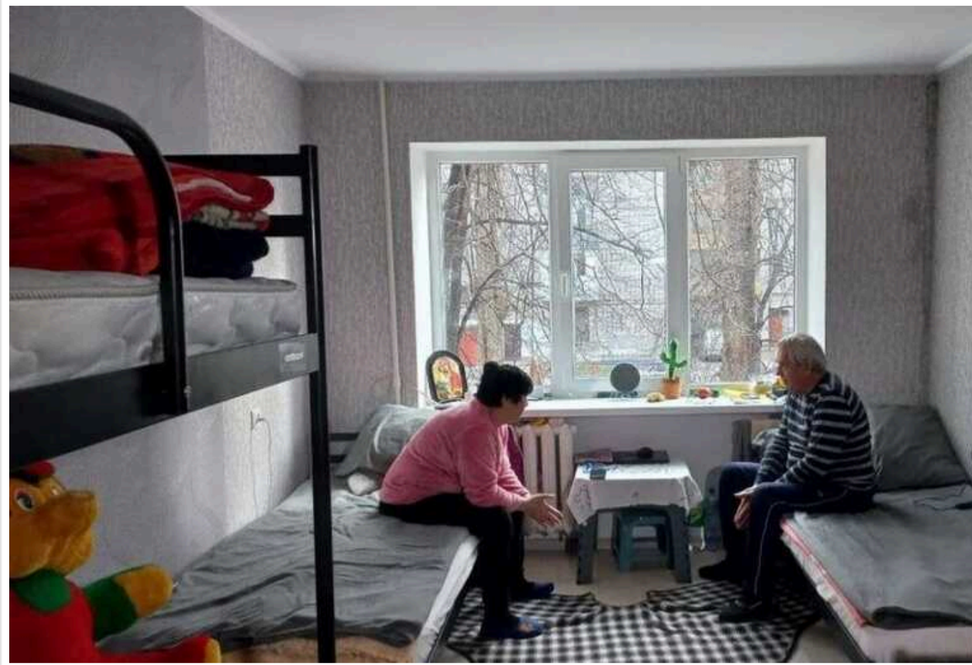
Кабмін заборонив виселяти із тимчасового житла вразливі категорії внутрішніх переселенців

Кабінет міністрів вніс зміни до Порядку формування фондів житла, призначеного для тимчасового проживання, обліку та надання такого житла для тимчасового проживання ВПО, затвердженого Постановою КМУ від 29 квітня 2022 року №495.