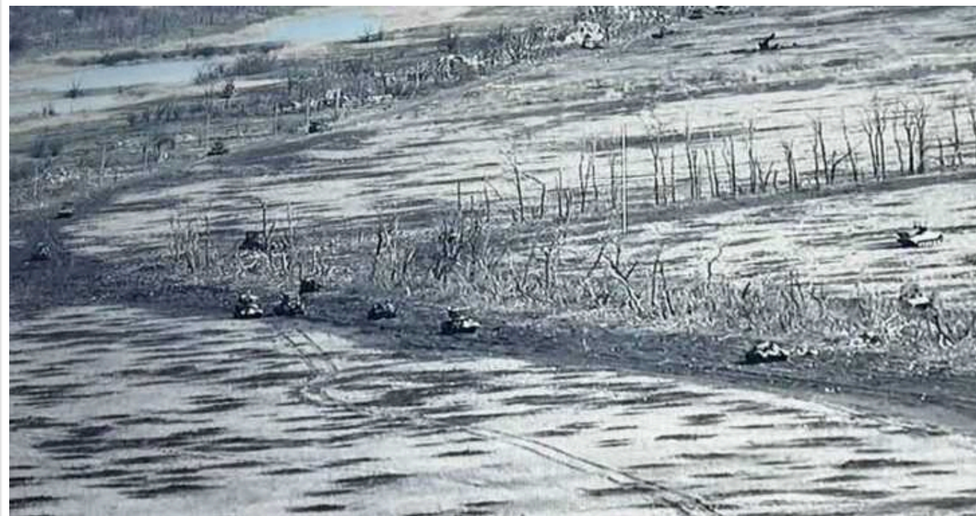
Forbes: 30 березня під Авдіївкою ЗС РФ провели один із найбільших танкових наступів

Видання Forbes пише, що в суботу під Авдіївкою армія РФ провела один із найбільших танкових наступів.