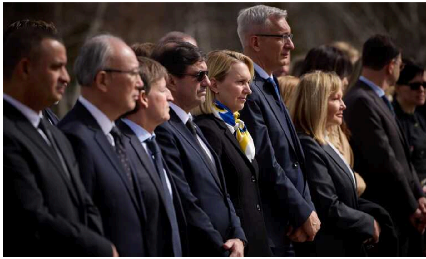
У Бучі під час другої річниці визволення міста низка послів вшанували пам'ять загиблих

Низка послів разом з президентом України Володимиром Зеленським 31 березня відвідали Бучу та вшанували пам'ять загиблих у місті та загалом у північних областях України, які побували під окупацією на початку повномасштабної війни.