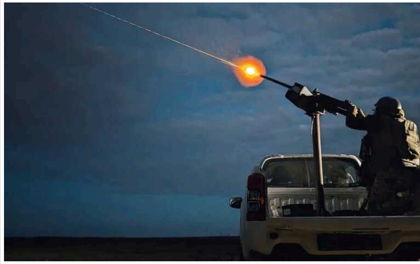
РФ обстріляла Україну з бомбардувальників Ту-95МС: на заході України було чути вибухи

У ніч проти неділі, 31 березня, країна-агресор РФ після атаки "шахедами" запустила по Україні й серію крилатих ракет. Ворожі цілі пролетіли з півночі на захід, у декількох регіонах лунали вибухи – працювала ППО.