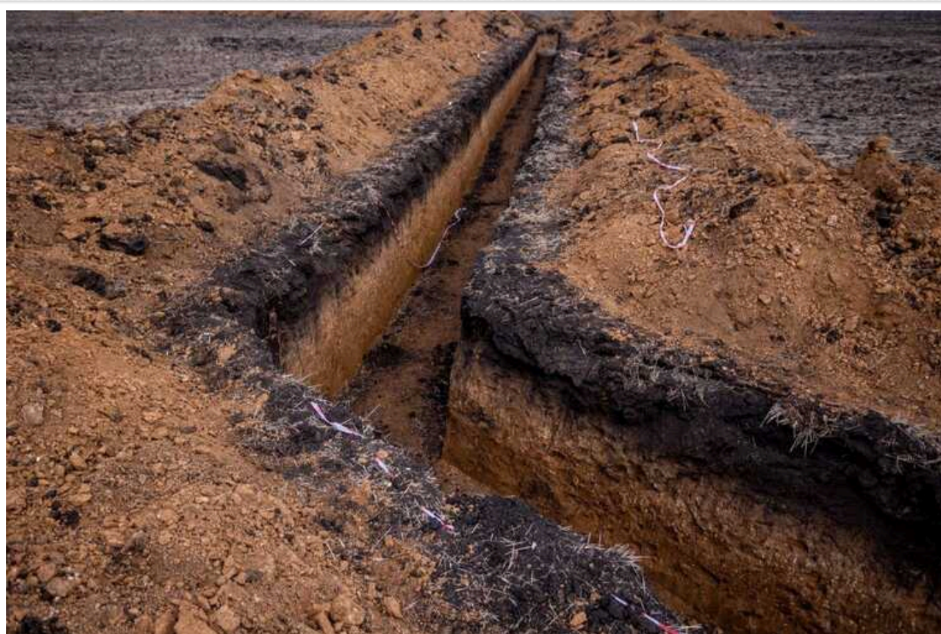
У Дніпропетровській ОДА показали будівництво фортифікацій

На Дніпропетровщині будуть фортифікації. Вже викопали понад 42 км протитанкових ровів.