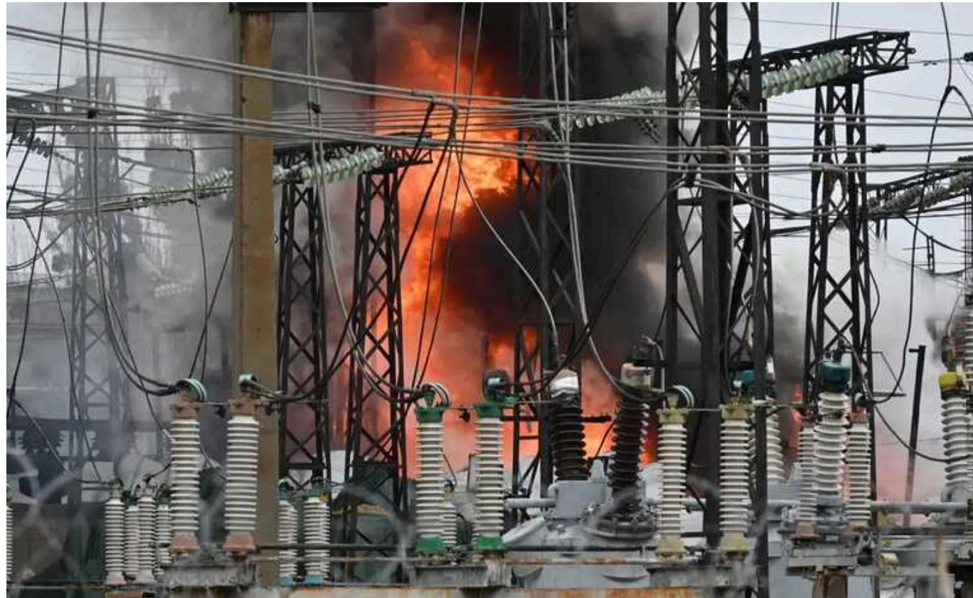
У ВР хочуть змінити структуру енергомережі України, щоб зменшити ракетні удари РФ

Читати на русском Read in English Додати як бажане джерело в Google