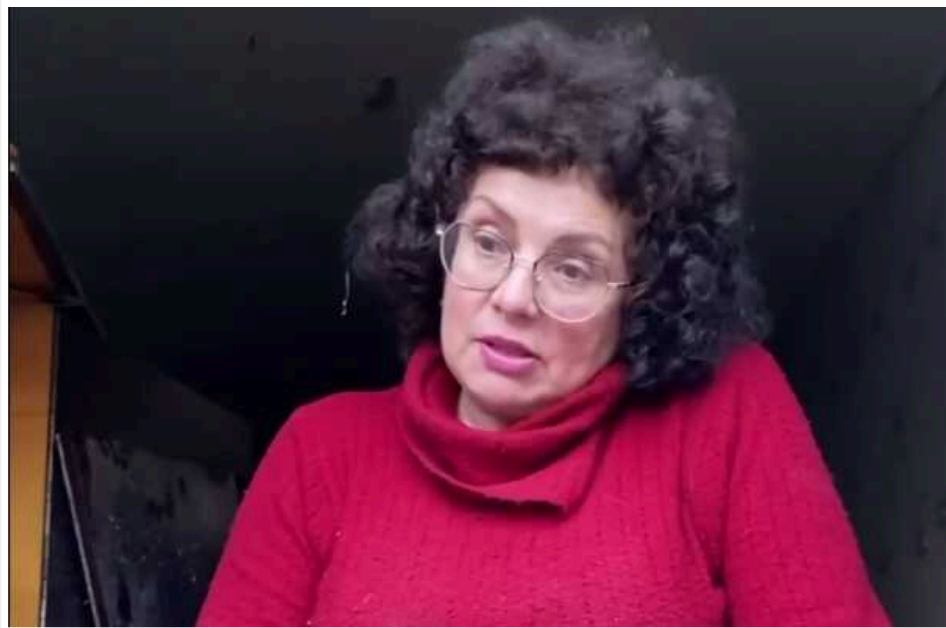
Проти харків'янки, будинок якої постраждав від недавнього обстрілу, порушили кримінальну справу за «проросійську позицію»

На мешканку Харкова, до будинку якої був приліт 27 березня, завели кримінальну справу за "проросійську позицію".