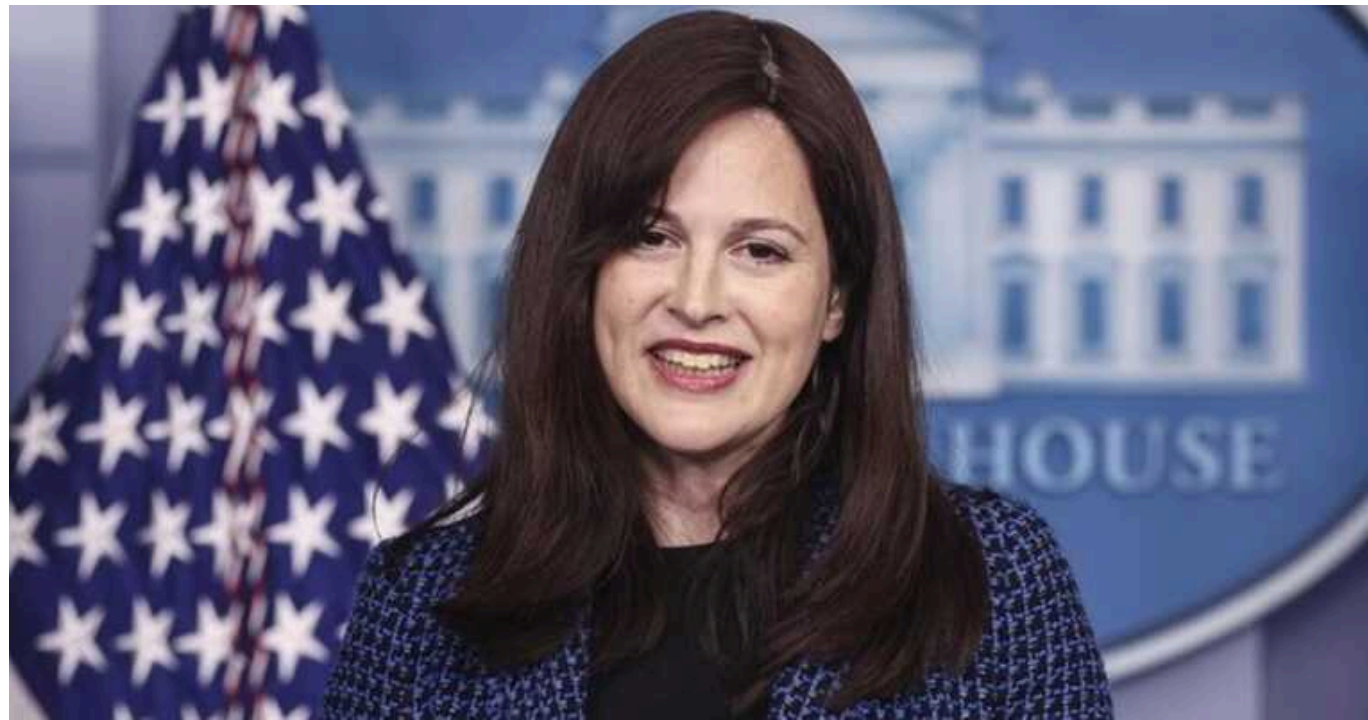
Україна потребує додаткових засобів ППО, Конгрес має схвалити допомогу, – Білий дім

У Білому домі на тлі російських атак на українську енергосистему вкотре закликали Палату представників Конгресу США схвалити допомогу Україні, яка б забезпечила постачання нових засобів ППО Києву.