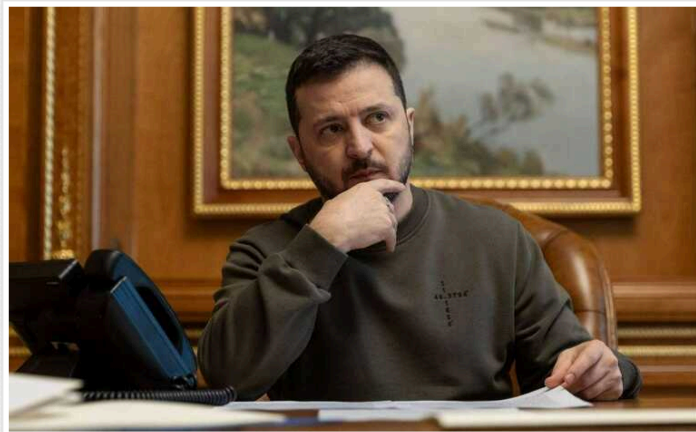
Якщо фронт залишатиметься стабільним, Україна зможе озброїти та навчити нові бригади для контрнаступу цього річ, — Зеленський

Таку думку висловив Президент України Володимир Зеленський в інтерв'ю The Washington Post , опублікованому у п'ятницю, 29 березня.