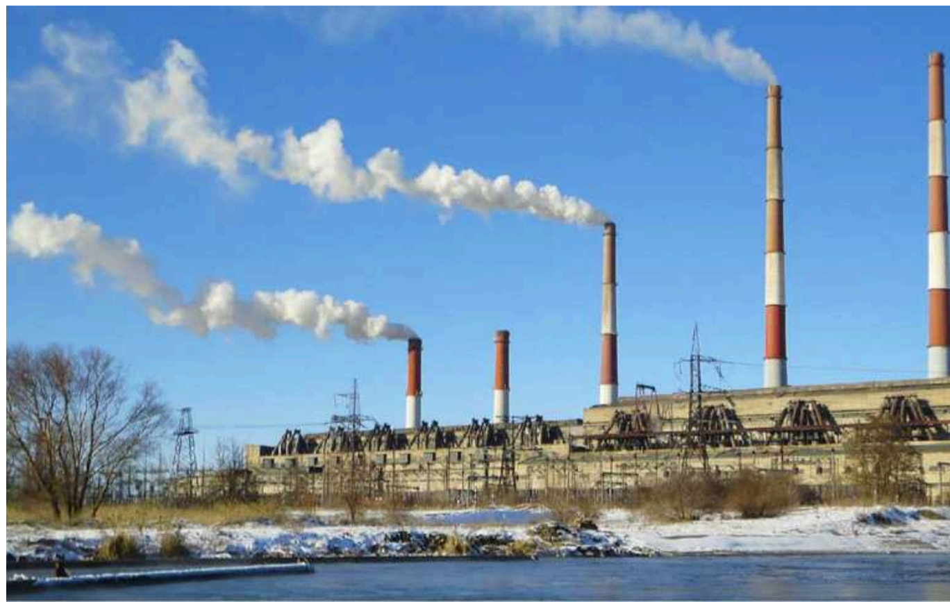
Унаслідок ракетного удару 22 березня Зміївська ТЕС у Харківській області була повністю зруйнована

На сайті «Центрэнерго» повідомляється, що Зміївська ТЕС у Харківській області була повністю зруйнована внаслідок ракетного удару 22 березня.