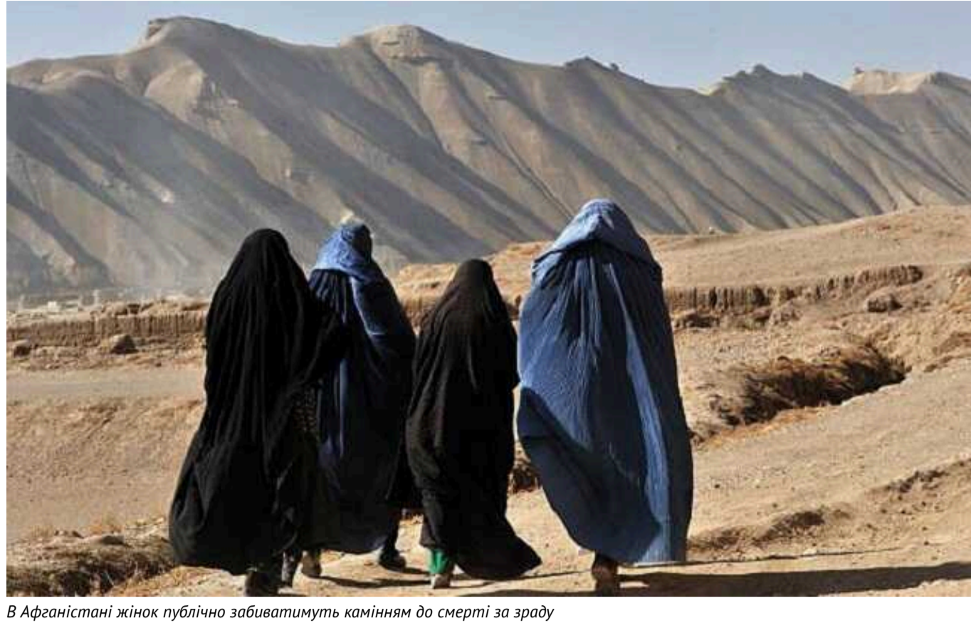
В Афганістані жінок публічно забиватимуть камінням до смерті за зраду

Видання The Telegraph повідомляє, що в Афганістані жінок публічно забиватимуть камінням до смерті за зраду.