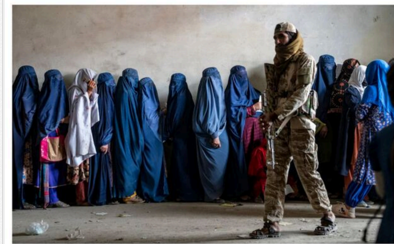
The Taliban has quickly returned to harsh public punishments in Afghanistan

Теги: Смертна кара Смертная казнь Зрада Измена жінки Женщины Талибани Афганістан Афганістан