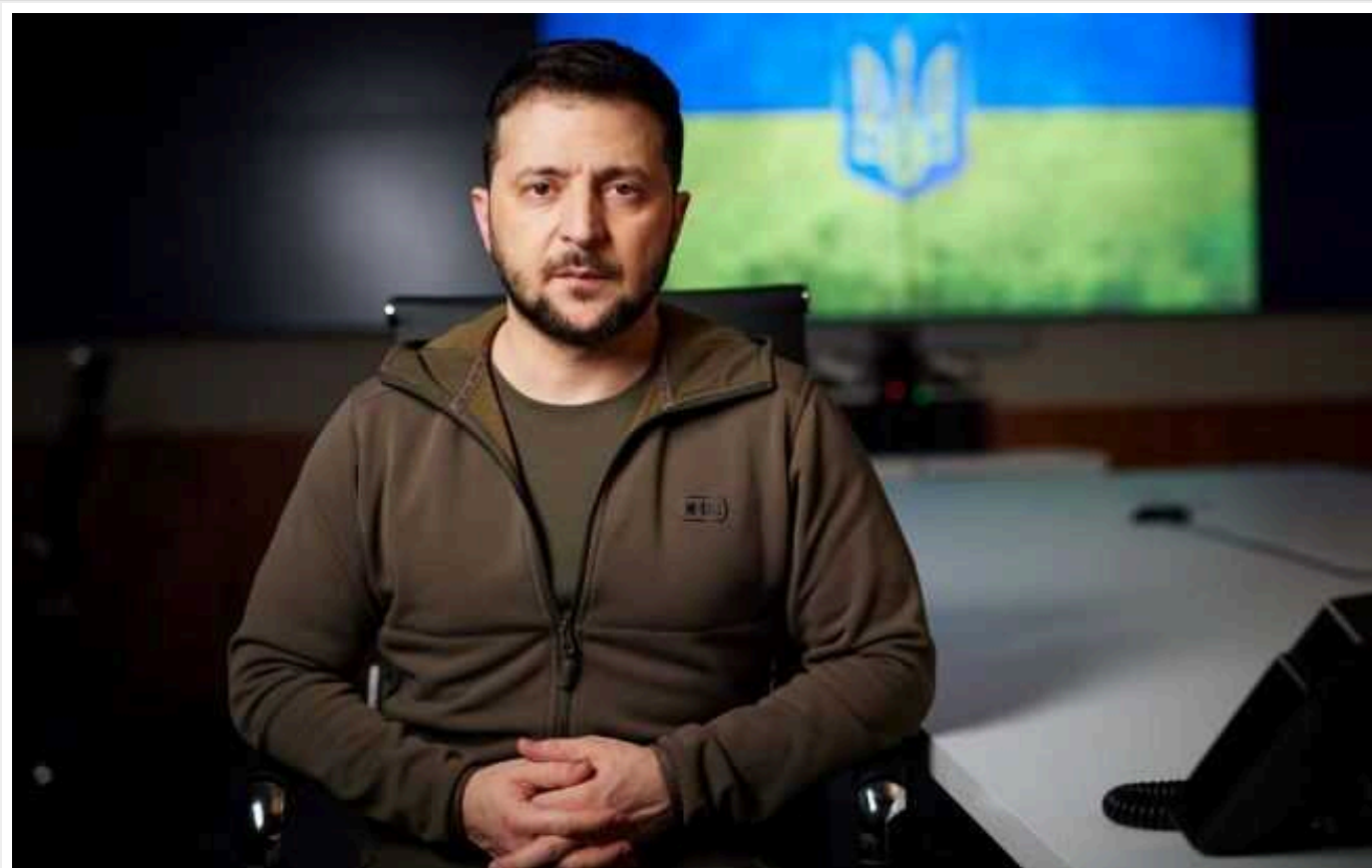
Зеленський відреагував на петицію про заборону онлайн-казино для військових: "Доручив запропонувати рішення"

Президент України Володимир Зеленський ще не визначився з позицією щодо ігromанії серед українських захисників. Наразі він збирає інформацію по цьому питанню.