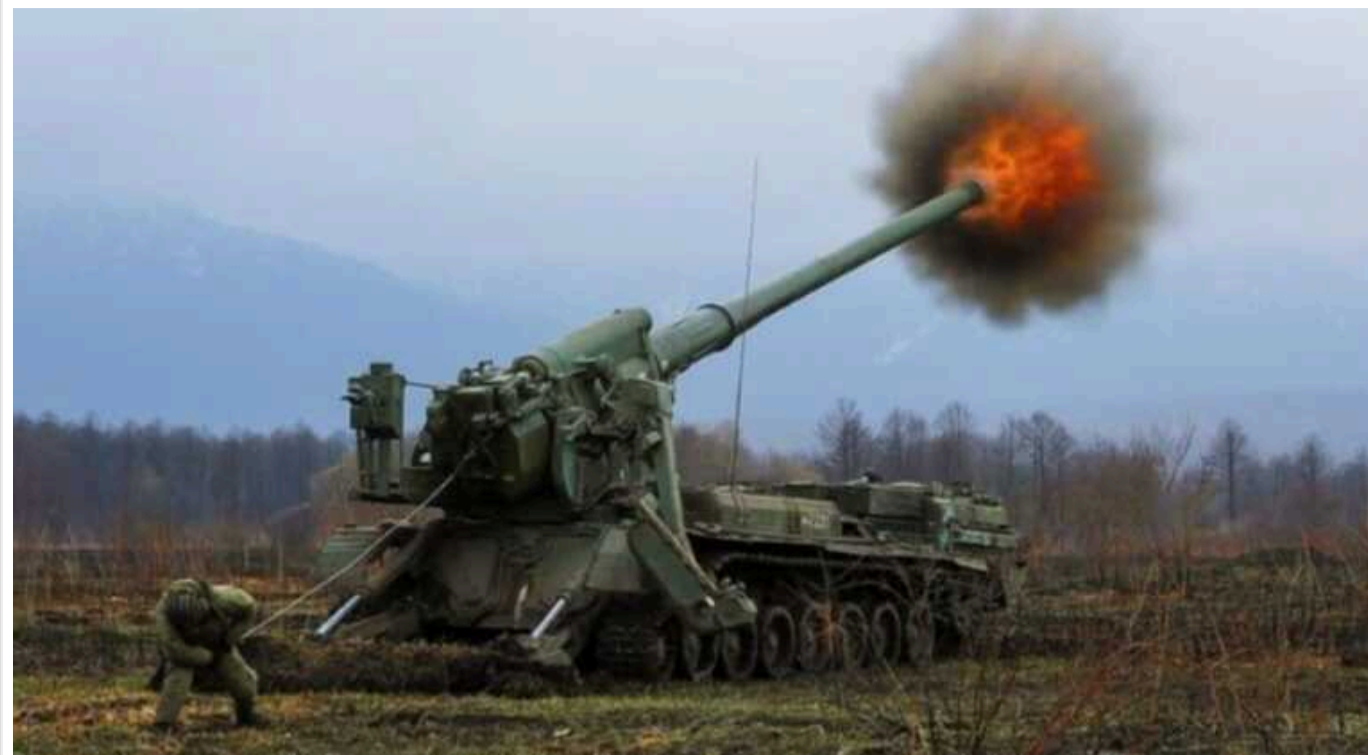
РФ подвоїла імпорт ключового інгредієнта для пороху і ракетного палива за допомогою Заходу, - WSJ

Американські, німецькі та тайванські фірми виробляють нітроцелюлозу, яка, попри санкції, постачалася до Росії, причому здебільшого - через одну турецьку компанію.