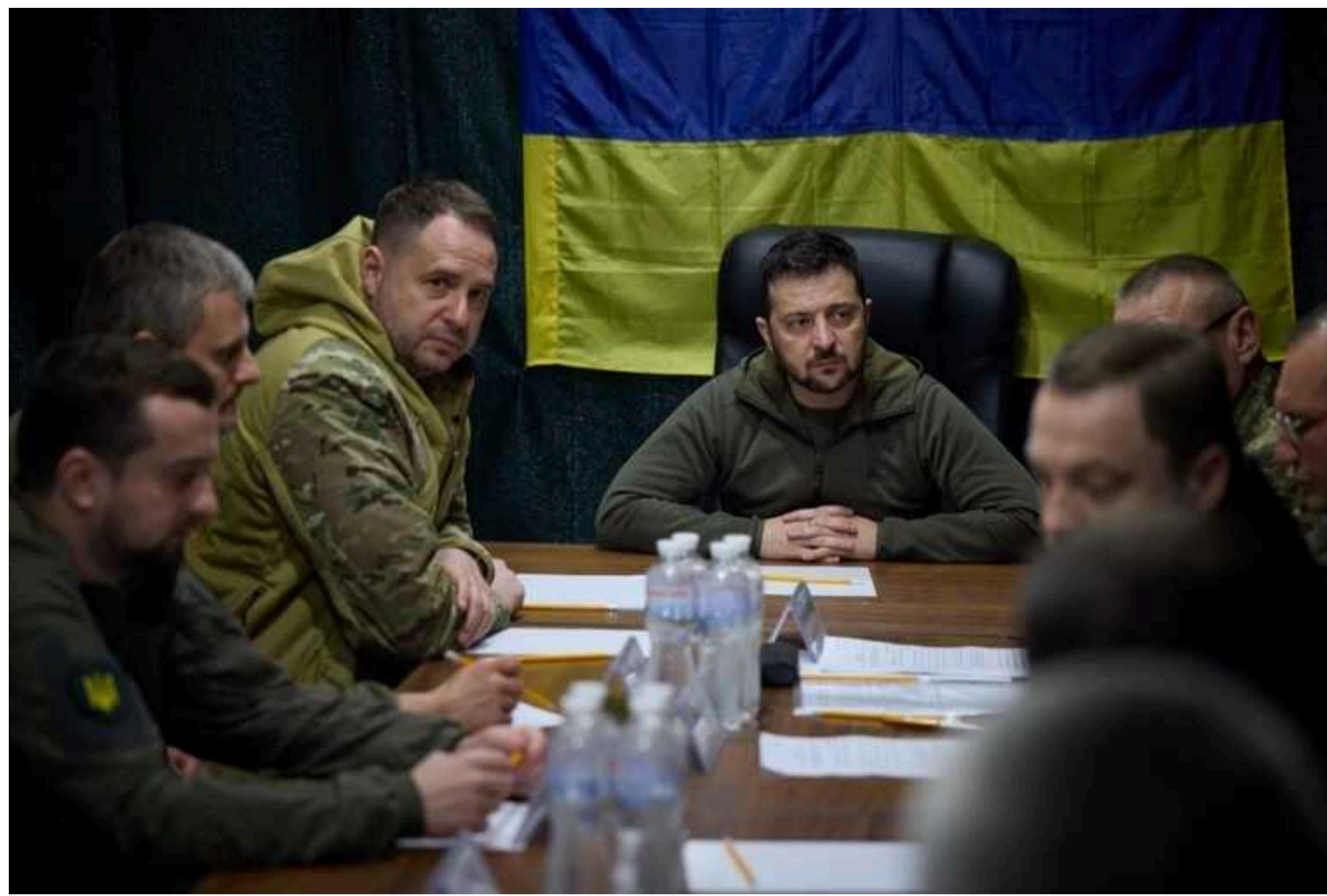
Зеленський провів засідання Ставки і назвав ключові питання: "Цієї ночі цілями ворога стали Канівська та Дністровська ГЕС"

Президент Володимир Зеленський 29 березня провів засідання Ставки Верховного головнокомандувача. На ньому обговорювали російські атаки на енергетичну інфраструктуру та способи її захисту, а також контракти на постачання зброї та боєприпасів у найближчій перспективі.