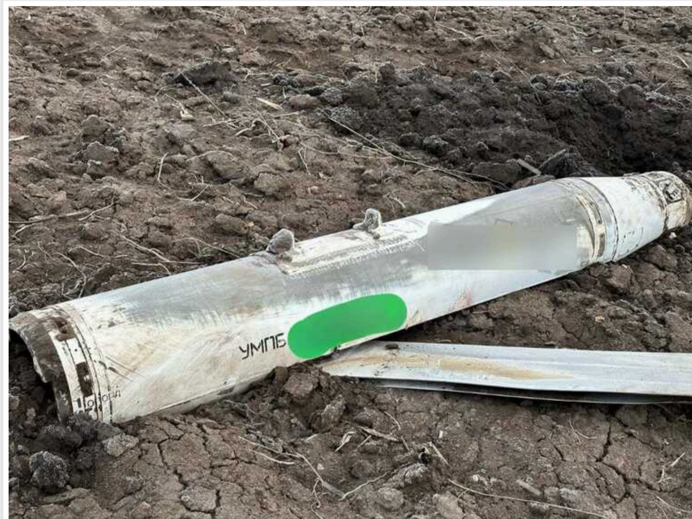
Новий російський керований боєприпас може долетіти до будь-якого району Харкова, - Синегубов

Керовані боєприпаси УМГБ Д-30 СН, якими Росія вдарила по Харкову 27 березня, можуть долетіти до будь-якого району міста. Збивати ці бомби можна, але це питання військових.