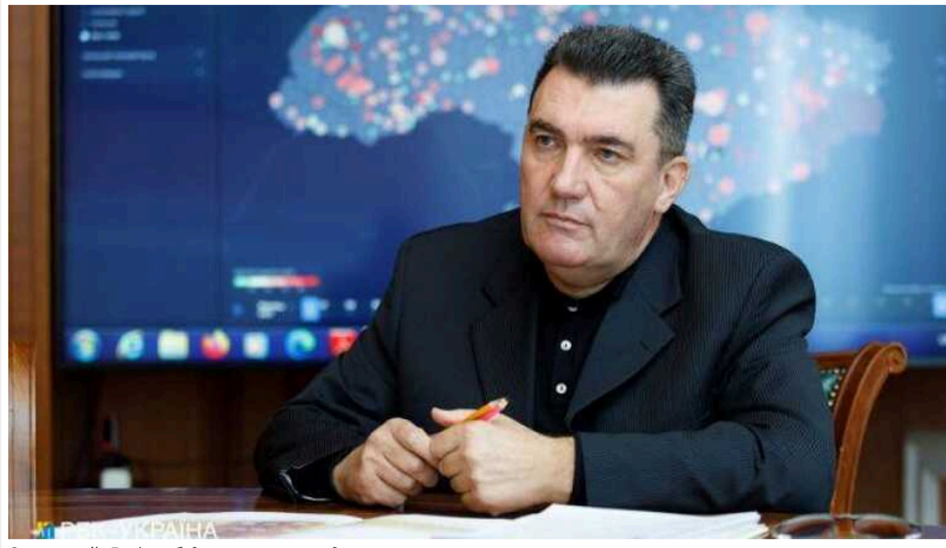
Зеленський: Данілов буде працювати на дипломатичному напрямку

Колишній секретар Ради національної безпеки і оборони України Олексій Данілов буде працювати в іншій сфері. Його переведуть на дипломатичний напрямок.