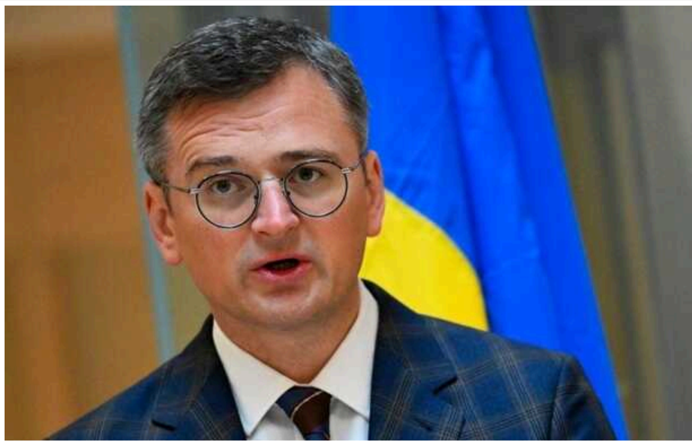
Financial Times: Кулеба, прибувши до Індії, намагається "відірвати її від Москви"

Міністр закордонних справ закликав Нью-Делі підтримати Україну та "переосмислити радянську спадщину" зв'язків із РФ, яка вже «випаровується».