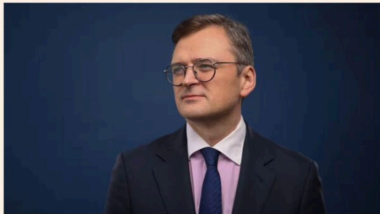
Dmytro Kuleba says the co-operation between India and Russia is based on a legacy that is 'evaporating'

Foreign Minister Dmytro Kuleba visits New Delhi in an effort to draw it away from Moscow