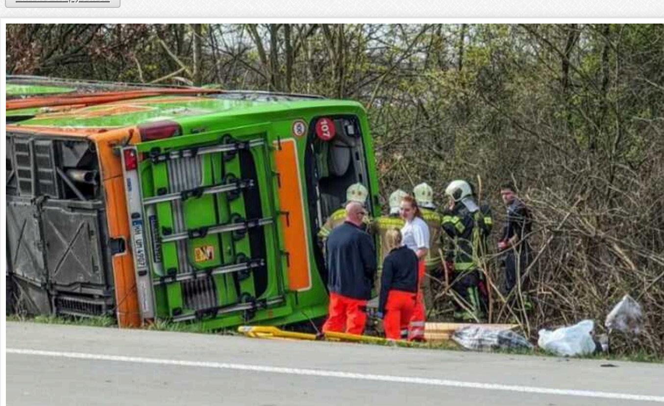
Смертельна ДТП у Німеччині: автобус FlixBus з'їхав у кювет, серед постраждалих – українки

Двоє громадян України постраждали в дорожньо-транспортній пригоді з автобусом FlixBus у Німеччині, яка трапилася біля Лейпцига вранці 27 березня. У ДТП загинули чотири людини і близько трьох десятків отримали травми.