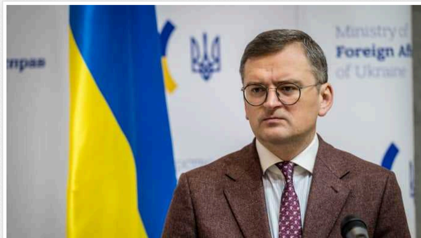
Кулеба попередив Індію про «червону лінію» через співпрацю з РФ

Глава МЗС України Дмитро Кулеба попередив Індію про "червоні лінії" у разі фінансування військової машини РФ.