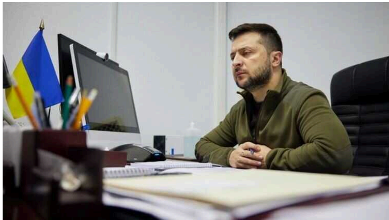
Зеленський: терор РФ лише збільшується, але українці здатні перегравати своєю сміливістю, рішучістю та ідеями

Президент України Володимир Зеленський заявив, що зростання терористичних загроз з боку Російської Федерації є очевидним. Але, за його словами, український народ виявляється здатним протистояти цим загрозам завдяки своїй сміливості, рішучості та ідеям.