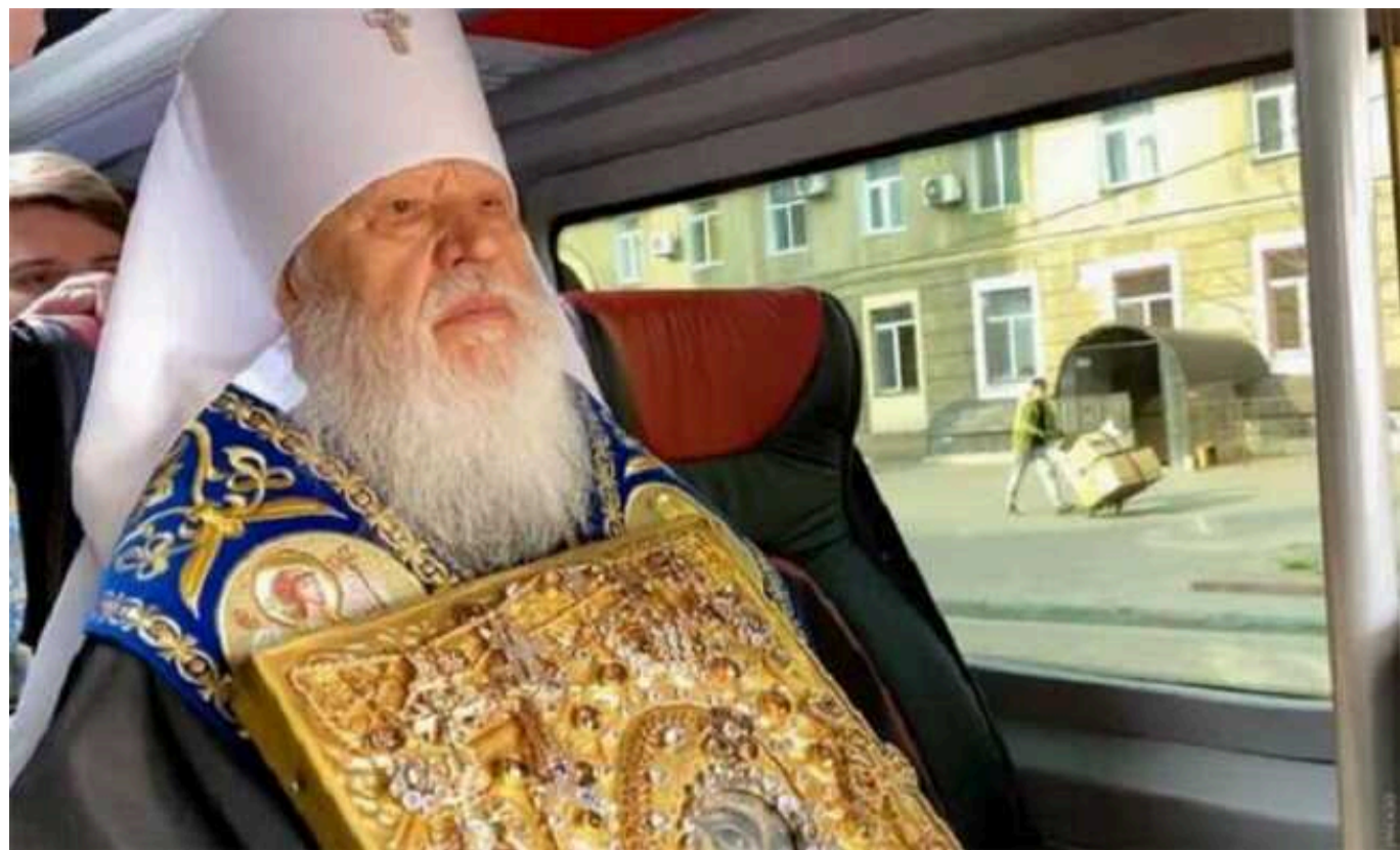
«Слуги народу» з Одеської облради поставили московського митрополита на бюджетне забезпечення

Проросійському митрополиту Агафангелу щомісяця збираються виплачувати понад дві тисячі гривень з місцевого бюджету.