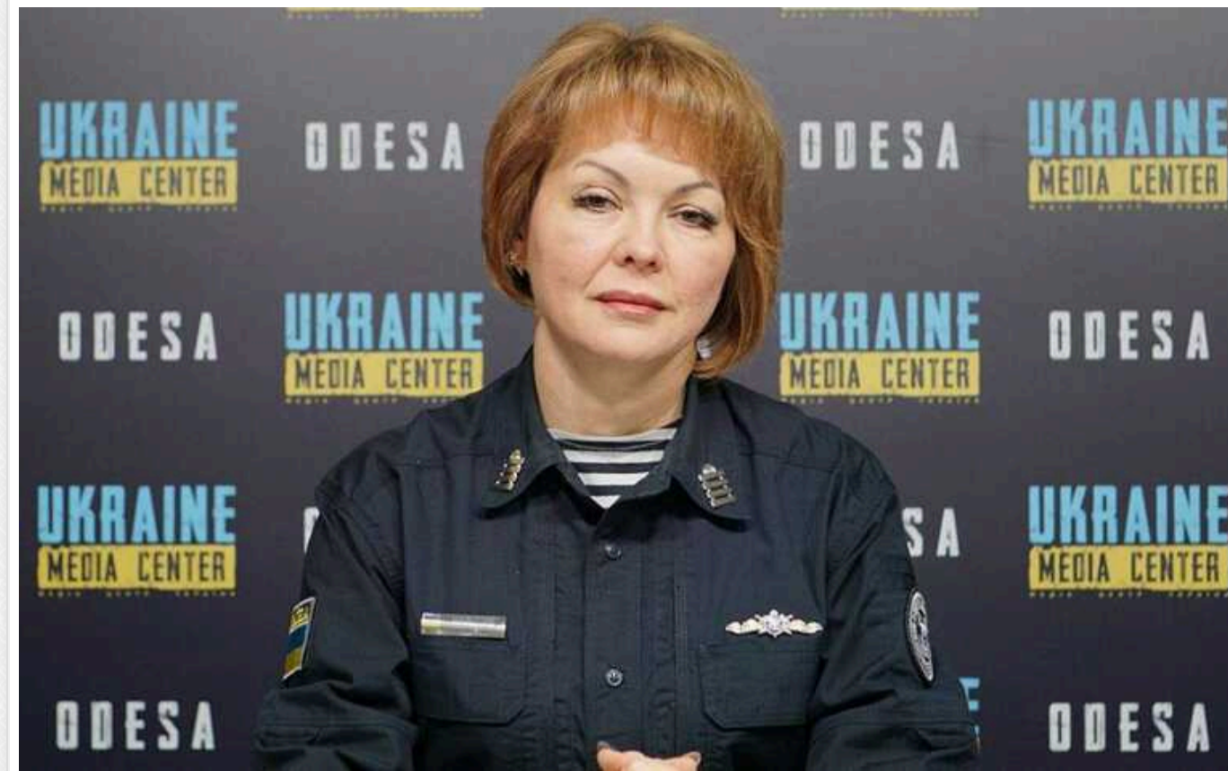
Окупанти модернізують авіабомби й активно застосовують авіацію, - Гуменюк розповіла, як і де саме

Читати на руском Read in English Додати як бажане джерело в Google