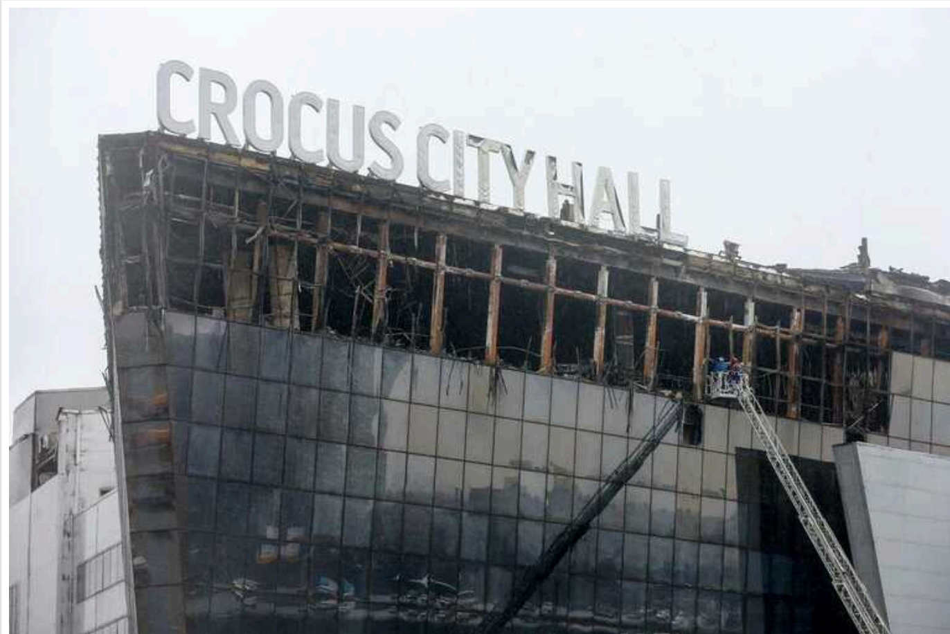
У РФ після теракту наростає міжетнічна ворожнеча, – The New York Times

У Росії посилилася ксенофобія, оскільки четверо затриманих, які нібито причетні до теракту, є вихідцями з Таджикистану.