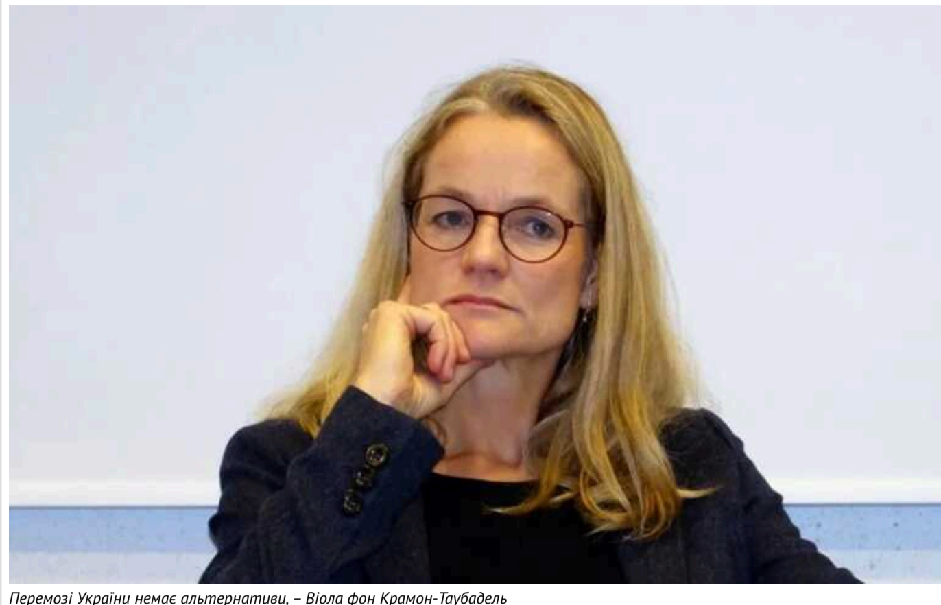
Перемозі України немає альтернативи, – Віола фон Крамон-Таубадель

Перемога України у війні проти РФ не має альтернативи. Якщо Україна зазнає поразки, це стане сигналом для інших диктаторів.