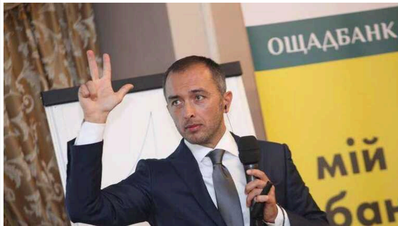
Лямець: «Ощадбанк» протягом 5 років використовував ПЗ, яке контролювалося російськими спецслужбами

«Ощадбанк» за часів керівництва Андрія Пишиного – протягом 2017–2021 років уклав 10 договорів на постачання послуг з обслуговування програмного забезпечення з компанією з російськими коренями – ТОВ «ОС Консалтинг» на загальну суму 165 млн грн.