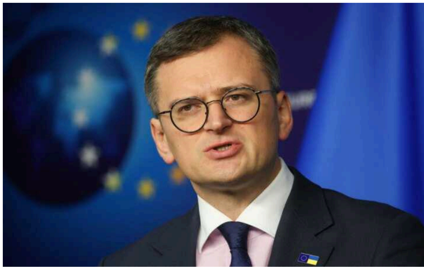
Кулеба 28–29 березня відвідає Індію

Міністр закордонних справ України Дмитро Кулеба 28–29 березня відвідає Індію з візитом на запрошення свого індійського колеги Субраманьяма Джайшанкара.