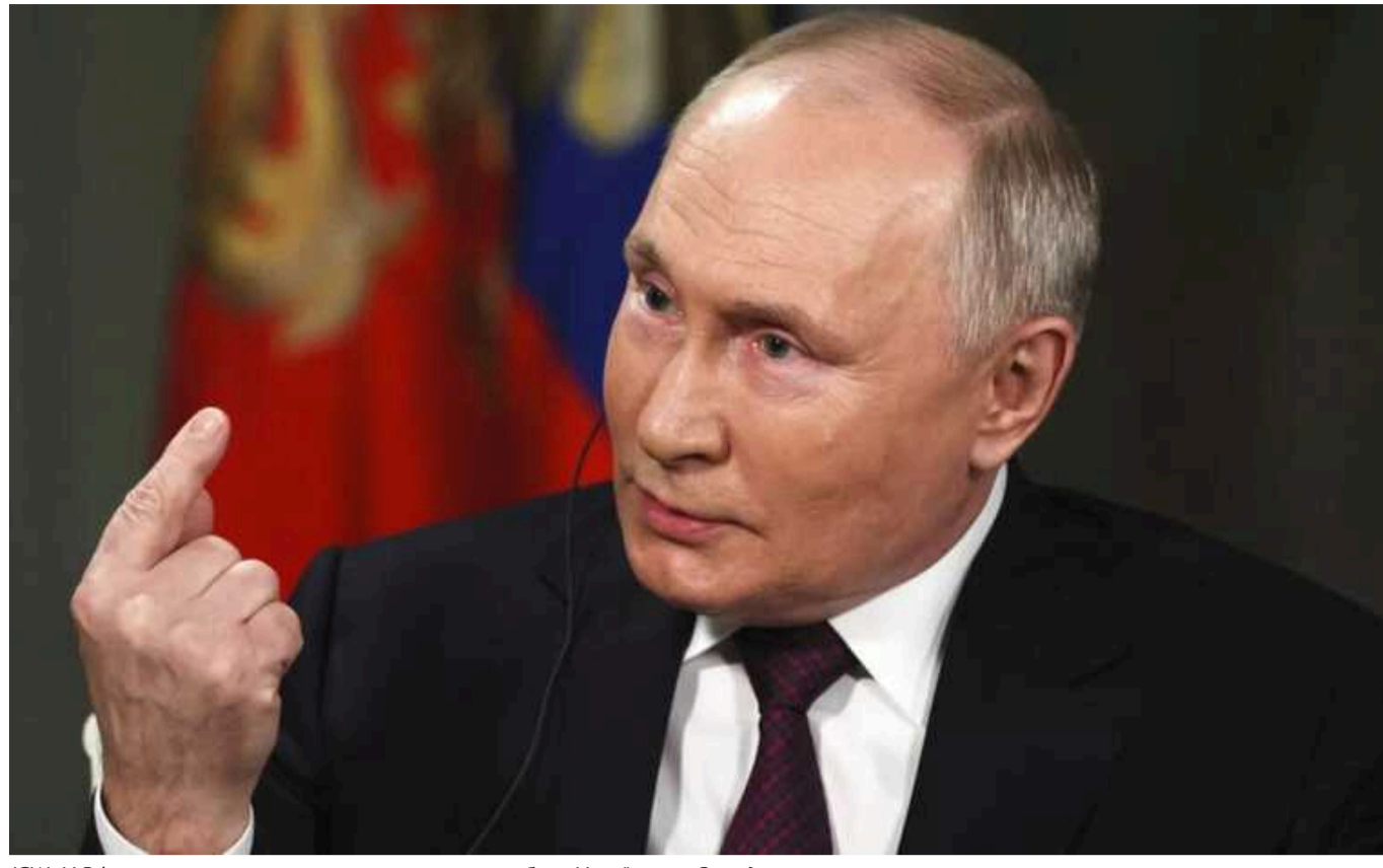
ISW: У РФ посилюють риторичку про «загрози» з боку України та Заходу

Російські офіційні особи пов'язують США та Захід із ширшим набором "терористичних" атак на РФ після нападу терористів на "Крокус Сіті Холл" 22 березня. Вони посилюють риторичку про передбачувані західні й українські загрози, щоб викликати велику внутрішню підтримку війни.