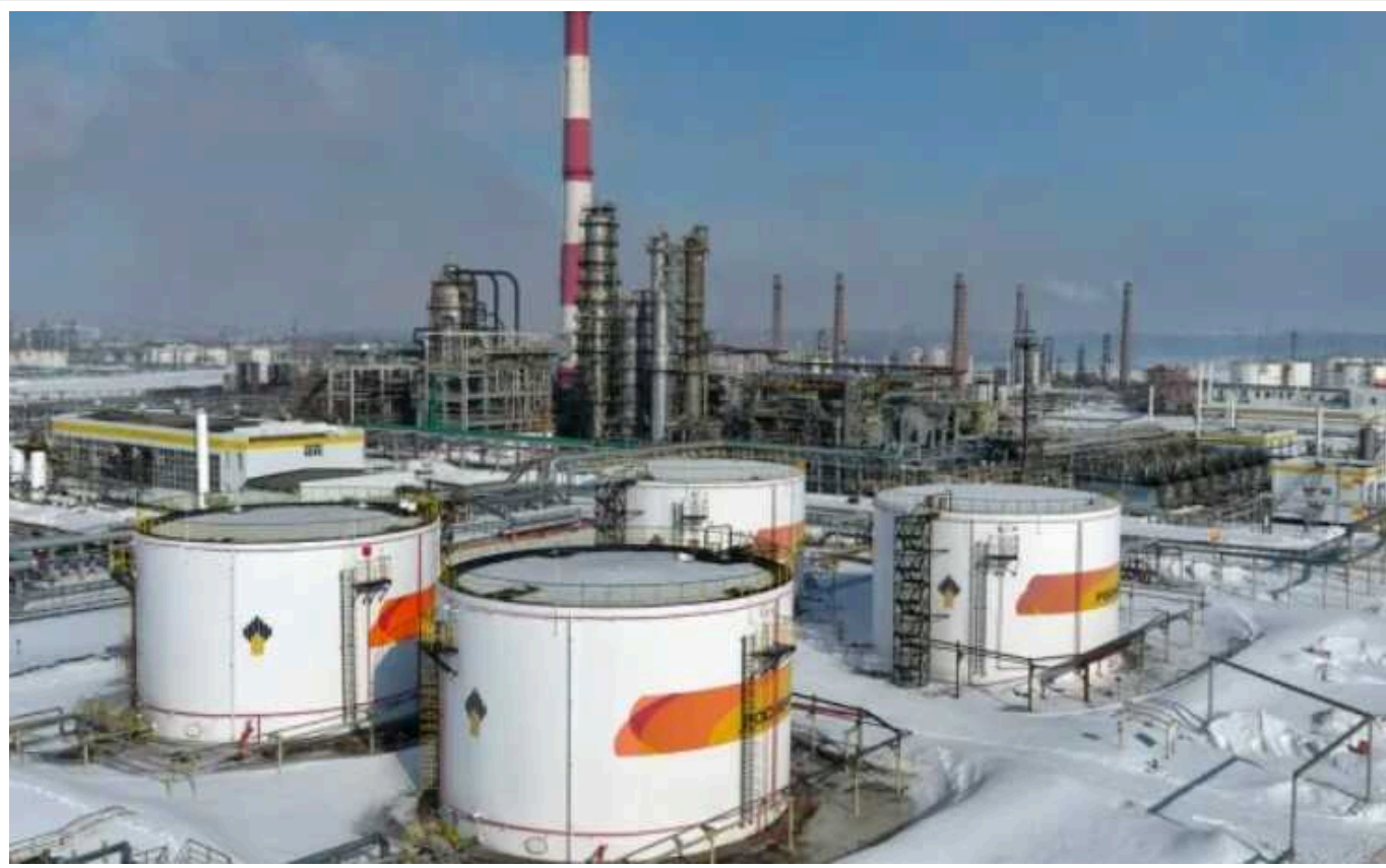
Путін перетворив енергоносії на геополітичну зброю, - Єрмак

За словами керівника ОП Андрія Єрмака, саме неймовірні доходи РФ від експорту енергоносіїв переконують Путіна в тому, що світ закріє очі і на Сирію, і на Грузію, і на повномасштабне вторгнення в Україну.