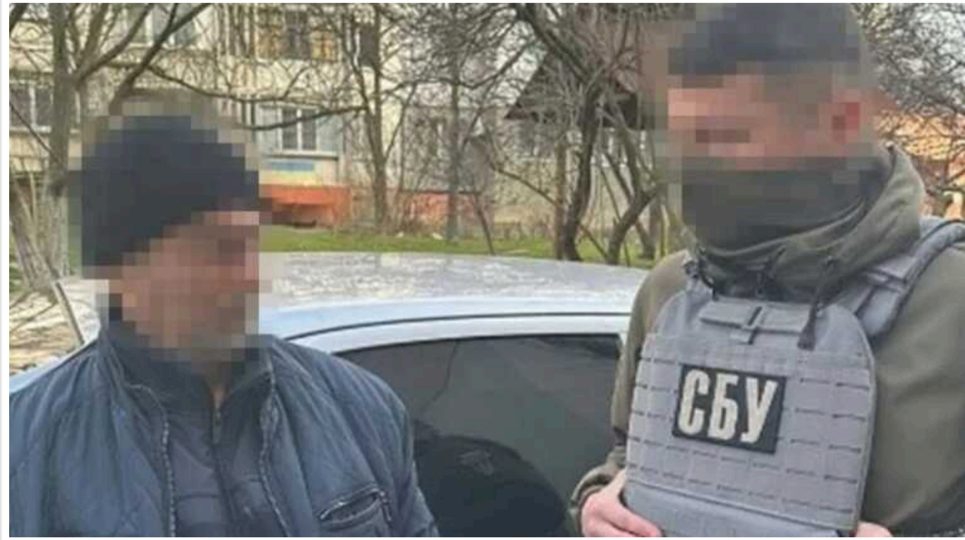
СБУ затримала у Херсоні ексохоронця катівні окупантів, який намагався втекти за кордон

Співробітники Служби безпеки України затримали у Херсоні колишнього охоронця російської катівні. Він наглядав за камерами, в яких тримали ув'язнених учасників руху опору в регіоні, катували їх та намагалися вибити згоду на співпрацю.