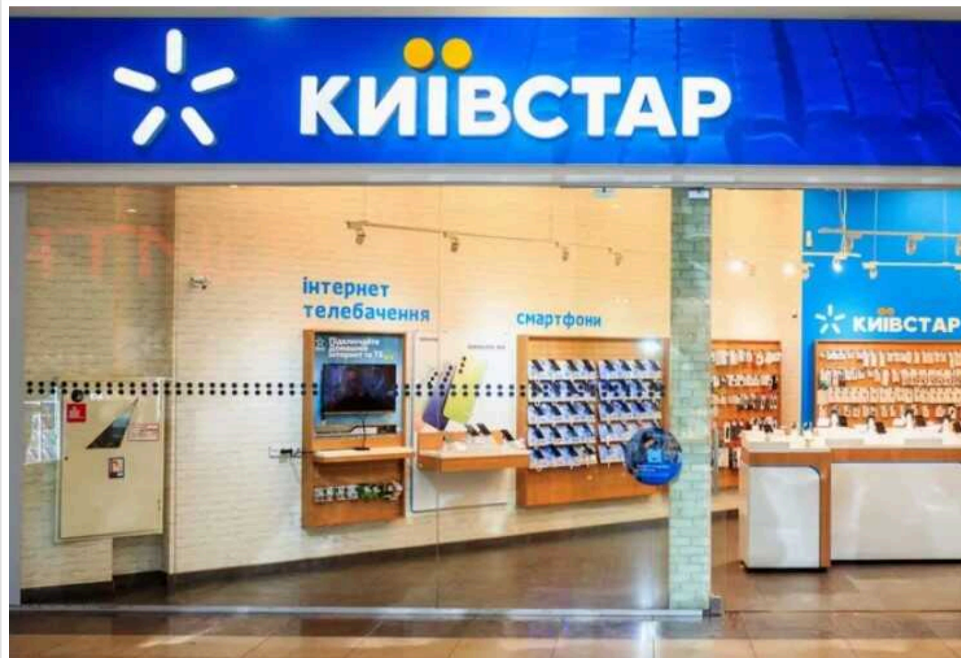
"Київстар" змінює ціни на тарифи

Український мобільний оператор "Київстар" готує оновлення низки своїх тарифів. Причому як їхнього наповнення, так і вартості. Зокрема, повідомляється про здорожчання пропозицій на 25-55 грн: наприклад, Love UA – на 50 грн, зі 150 до 200 грн, а без кордонів lite – на 25 грн, з 75 до 100 грн.