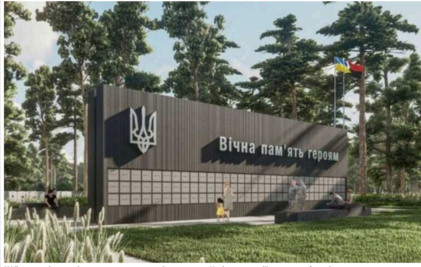
У Мінветеранів розповіли, коли плануються перші поховання на Національному військовому кладовищі

Виконуючий обов'язки міністра у справах ветеранів Олександр Порхун заявив, що наприкінці серпня - на початку вересня цього року можуть відбутися перші поховання на Національному військовому меморіальному кладовищі.