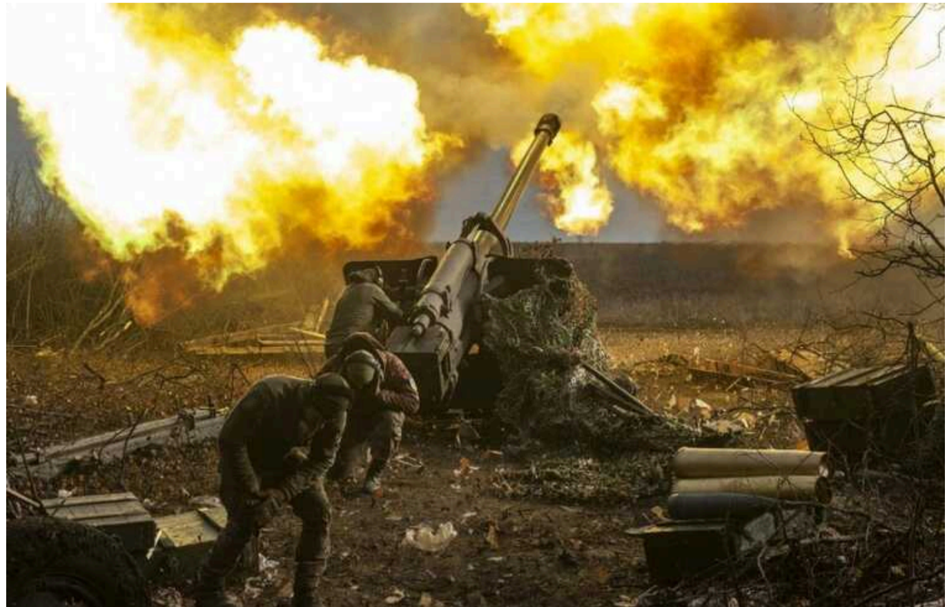
Наступні 5-8 місяців можуть стати вирішальними у війні в Україні – The Economist

Протягом найближчих кількох місяців, російська окупаційна армія може посилити свій наступ. Водночас Україна зіткнулася з проблемами зі зброєю, мобілізацією та будівництвом оборонних споруд.