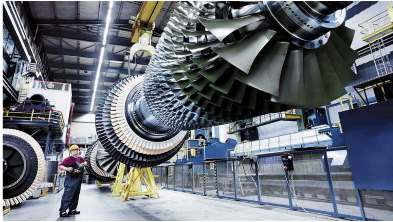
У Німеччині висунили звинувачення п'ятьом особам, які постачали турбіни Siemens в окупований Крим

Правоохоронці Німеччини висунули звинувачення п'ятьом особам, які причетні до поставок турбін Siemens в окупований Крим попри санкції.