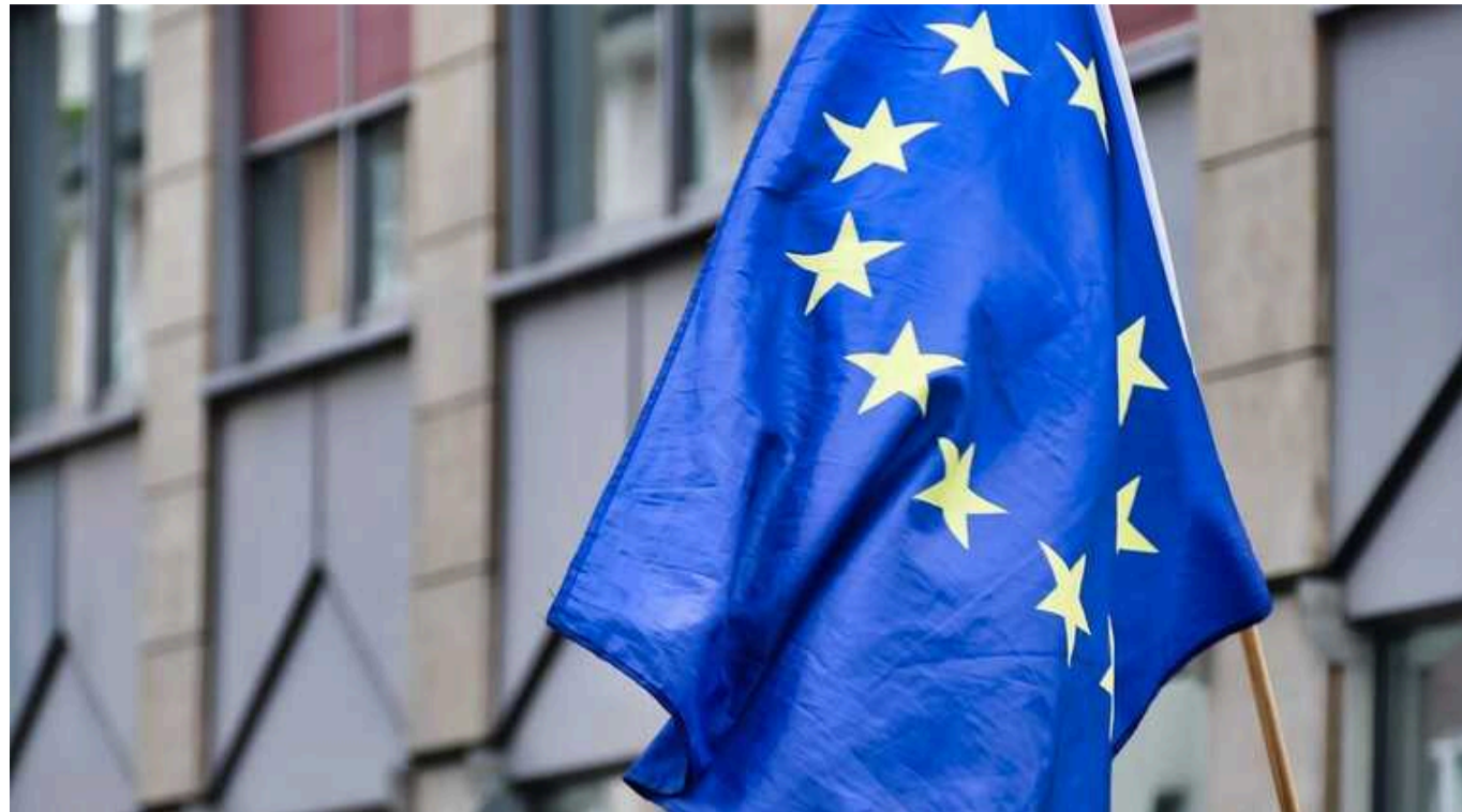
Reuters: Посли ЄС обговорять обмеження на імпорт продовольства з України

Посли Європейського Союзу сьогодні, 27 березня, обговорять нові обмеження щодо імпорту української сільськогосподарської продукції.