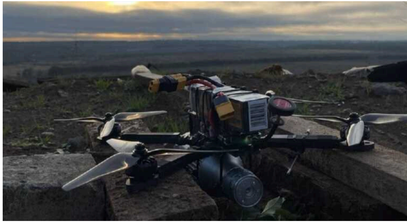
Росіяни випробовують нові FPV-дрони: безстрашні перед РЕБ і більш "самостійні" в небі

Блогер Сергій Стерненко розповів, що Росія працює над дронами, що здатні до донаведення на цілі, вже давно. Відомо, що після зльоту вони вишукують та ліквідують об'єкти без участі оператора.